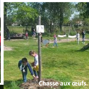
Chasse aux œufs