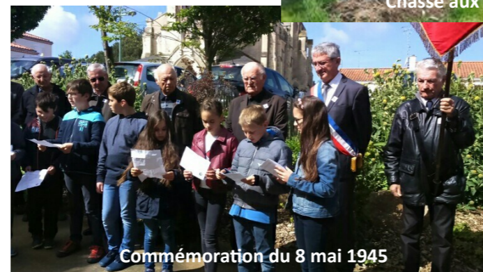
Commémoration du 8 mai 1945