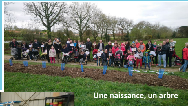
Une naissance, un arbre