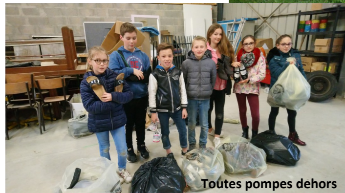
Toutes pompes dehors

Soyez responsables, les déchetteries sont prêtes à vous accueillir.