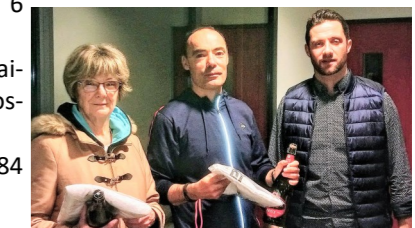
Vainqueur Tournoi double-mixte