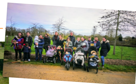
Une naissance, un arbre